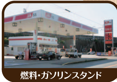
燃料・ガソリンスタンド