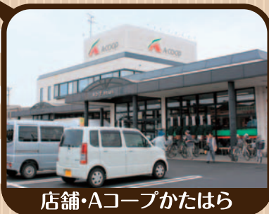
店舗・Aコープかたはら