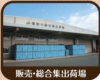
販売・総合集出荷場