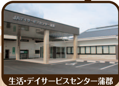
生活・デイサービスセンター蒲郡